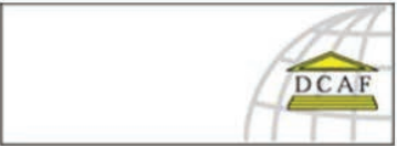
مركز جنيف للرقابة الديمقراطية على القوات المسلحة، سويسرا