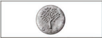
مؤسسة أبحاث الأوبزرفر ، الهند