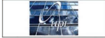
المعهد الفنلندي للشؤون الدولية ، فنلندا