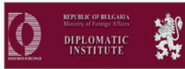
المعهد الدبلوماسي لوزارة خارجية جمهورية بلغاريا