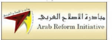
مبادرة الإصلاح العربي ، فرنسا