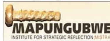
معهد ماينونجوي للتفكير الاستراتيجي جنوب إفريقيا (MISTRA)