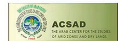
المركز العربي لدراسات المناطق الجافة والأراضي الجافة ، سوريا