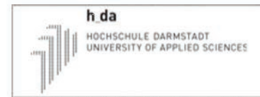
كلية دارمشتات للعلوم التطبيقية ، ألمانيا