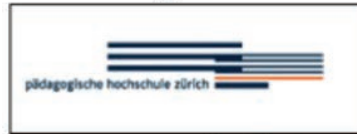
جامعة التربية زيورخ، سويسرا