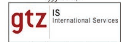
الجمعية الألمانية للتعاون الفني ، ألمانيا