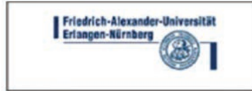
جامعة فريدريش ألكسندر ألمانيا