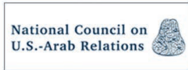
المجلس الوطني للعلاقات العربية الأميركية، الولاية المتحدة الأمريكية