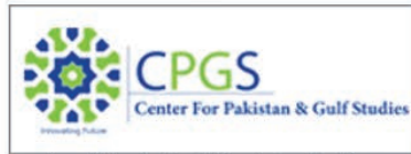
مركز الدراسات الباكستانية والخليجية (CPGS)